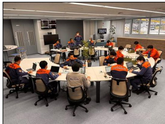
【湖西市消防防災センター】