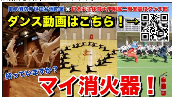
【動画のサムネイル】