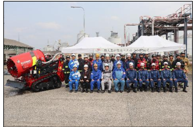
【運用開始式後の記念撮影】