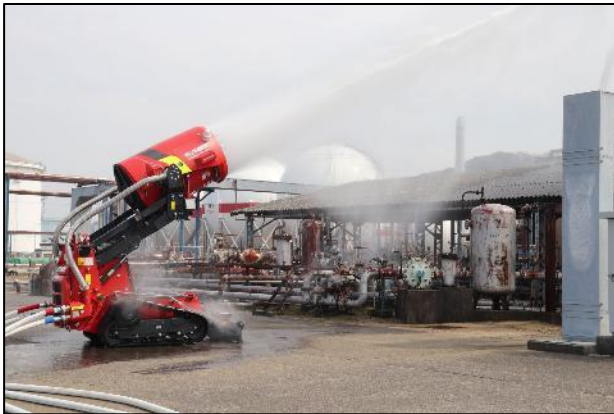
【無人走行放水ロボット】