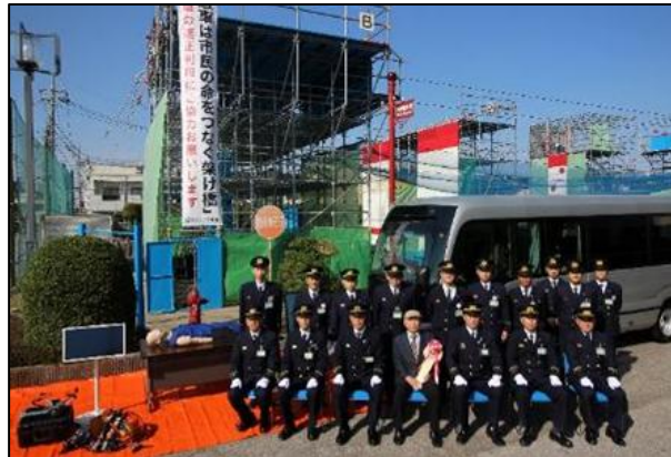
【贈呈後の記念撮影】