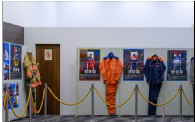
【常設した特設ブース】