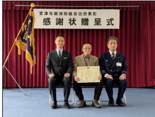
【贈呈後の記念撮影】