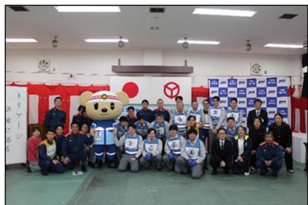
【訓練後の記念撮影】