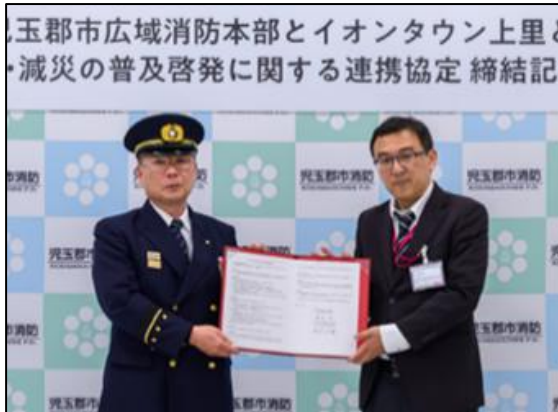
【締結記念式典の様子】

今後も、より一層連携を深め、地域に根ざした防災啓発活動を共に推進してまいります。