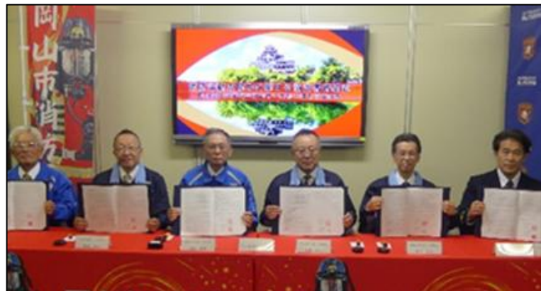
【締結式後の記念撮影】