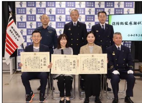
【贈呈後の記念撮影】

救護にあたったインストラクターの男性は、「今までで一番怖い体験でした。傷病者の方が助かって本当に良かったです。」と振り返りました。