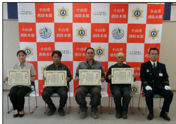
【贈呈後の記念撮影】