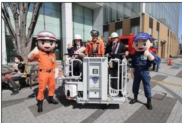
【一日消防署長委嘱後の記念撮影】