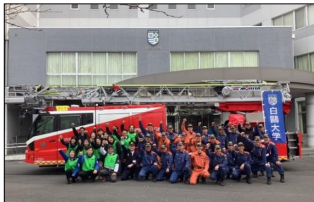
【訓練後の記念撮影】