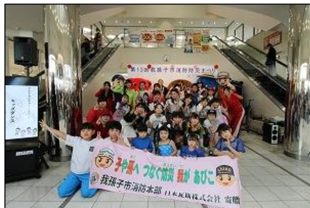
【演舞披露後の記念撮影】