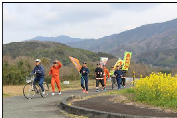
【防火広報マラソンの様子】