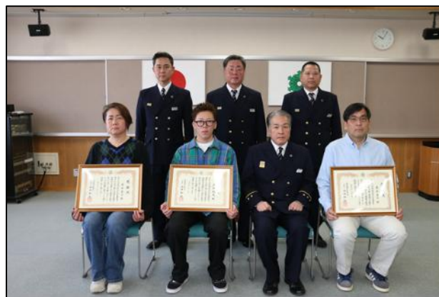
【感謝状贈呈後の記念撮影】

地域の安全を守るために行動された皆さまの高い防災意識と勇気ある行動に、心より敬意と感謝を申し上げます。