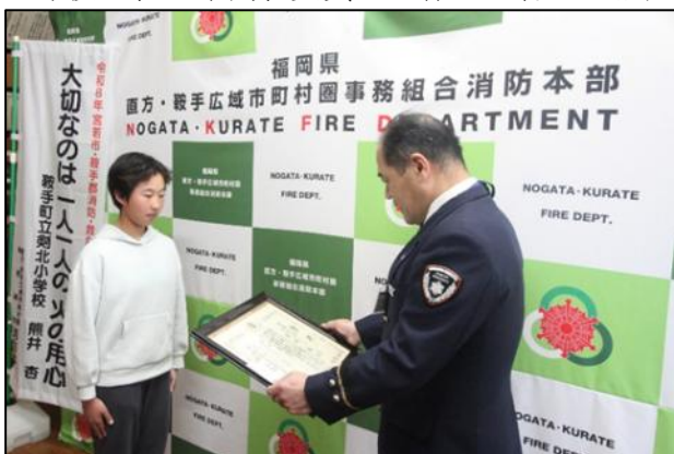
【表彰状贈呈の様子】

今後は、1年間、受賞した作品を管内の消防業務に係る広報活動に活用してまいります。