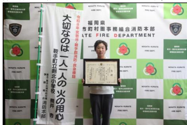
【表彰状贈呈後の記念撮影】