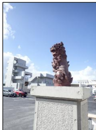
【遷座されたシーサー】