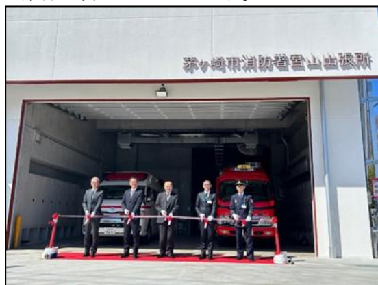
【完成披露式および開所式の様子】

現在、同町の中央に位置する寒川分署を令和13年までに南部地域に移転し、消防拠点を町内の南北にバランスよく整備することを計画しており、今後も、両市町で協力し、地域の安全・安心の確保に努めてまいります。