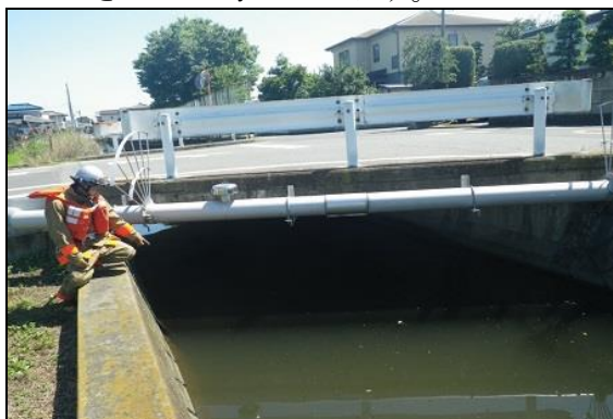
【重要水防箇所巡回の様子】

訓練後の検証会では課題点を抽出、改善策を検討し、実災害に向けより一層の対応力強化を図っていきたいと考えています。