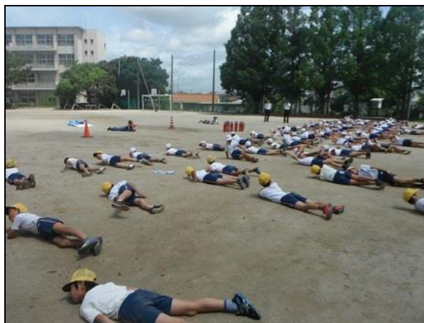
【着衣着火の消火方法】