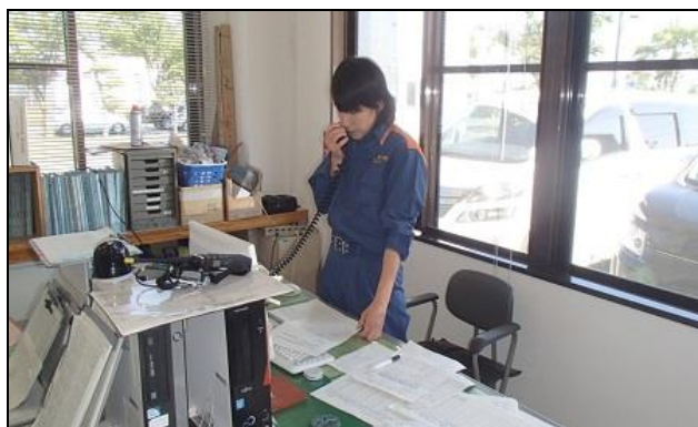
【報告受信及び移動配備指示の様子】