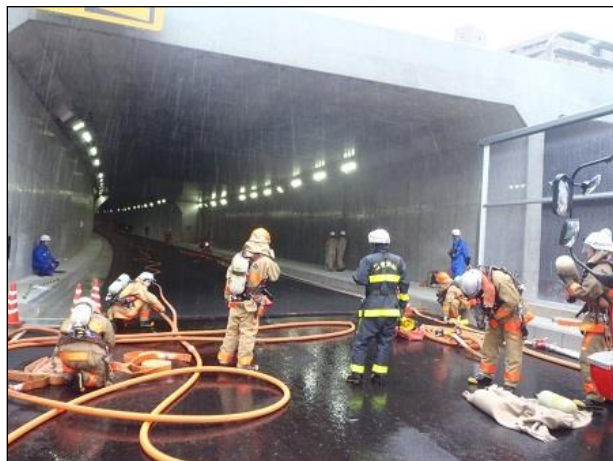
【車両火災対応訓練の様子】

空気呼吸器を着装した隊員が厳格な部隊統制、進入管理のもとにトンネル入口から120m地点にある事故車両までホースを延長、放水を実施し、事故車両からの要救助者の救出を行いました。特殊環境下での早期の状況把握、情報伝達を確立することによって現場対応能力の向上を図ることができました。