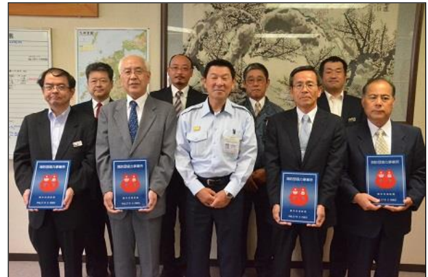
【熊本市消防団協力事業所表示証交付式の様子】