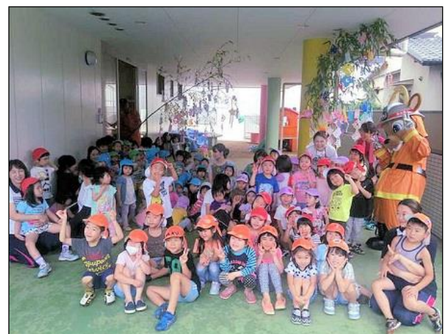
【防火七夕祭りの様子】

最後は、当市消防局マスコットキャラクターの「なっぴい」とともに記念撮影を行いました。