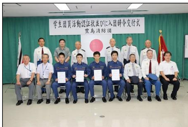
【学生団員活動認証状並びに入団辞令交付式の様子】