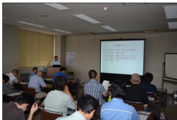
【初任者研修会の様子】

研修内容は、最近の事故事例を紹介しながら、危険物規制の概要や貯蔵取扱いの要点が主なものでした。参加者からは「事故事例をもっと知りたい。」「カリキュラムをもっと充実してもらいたい。」等のうれしい反響もあり、これらの要望を採り入れた内容とすべくアイデアを練るとともに、中堅クラスの従事者対象の研修会実施も検討しています。