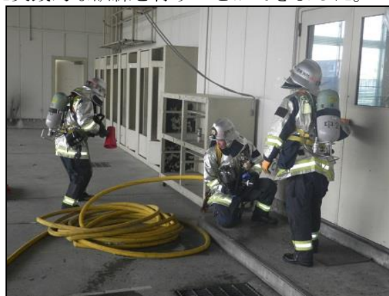
【火災対応訓練の様子】