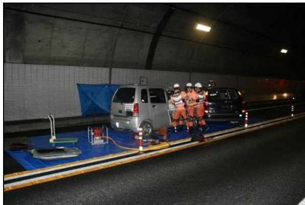
【総合防災訓練の様子】