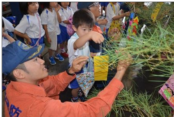
【幼年消防防火七夕の様子】