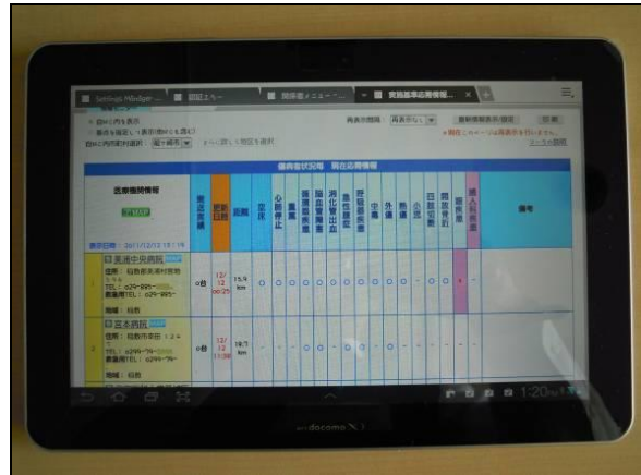
【タブレット端末画面】