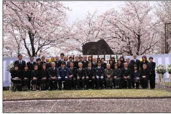
【消防慰霊祭の状況】