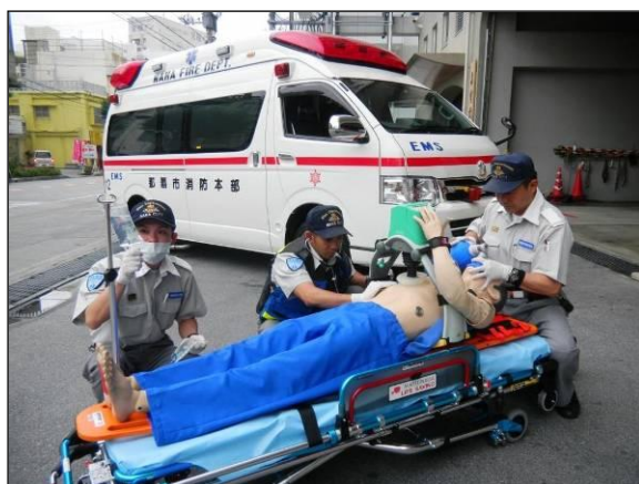
【新車両で訓練を実施する救急隊】