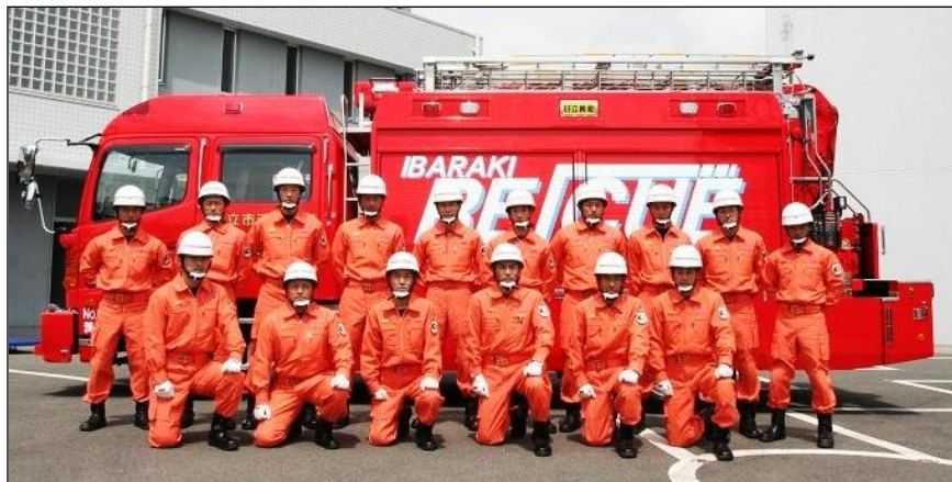
【市長から隊章の授与と発隊した高度救助隊】