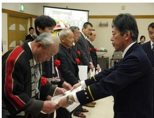
【消防局長から地域の自主防災組織に感謝状を授与】