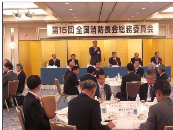
【総務委員会実施状況】

「東日本大震災からの復興に関し地方公共団体が実施する防災のための施策に必要な財源の確保に係る地方税の臨時特例に関する法律」の施行に伴う運用について