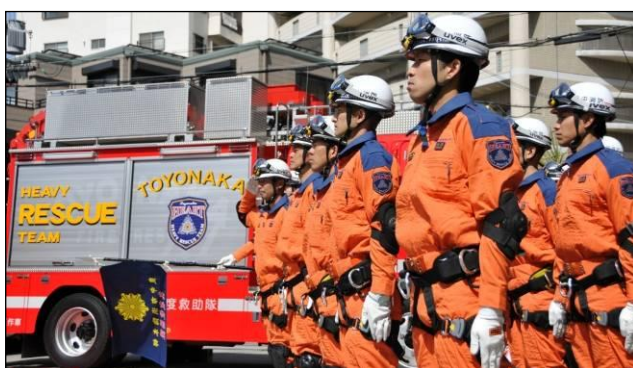
【高度救助隊の発隊と隊旗の授与】